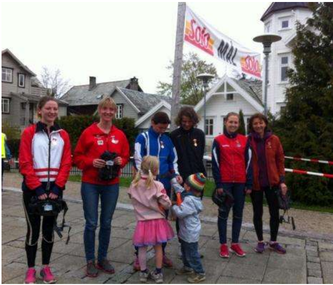
Pallen i dameklassen under dagens KM-sprintstafett i Hordaland.